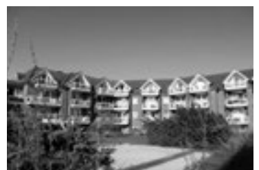
Residenzen Cuxhaven aktuelle Wiederverkäufe