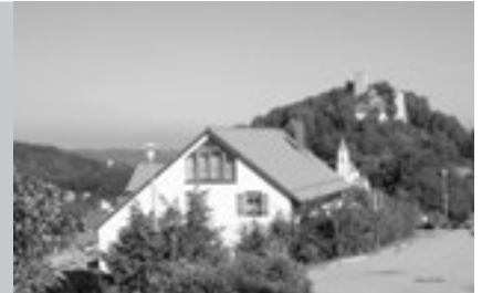
Ansicht: Residenz 2

Typ A 1-Zimmer-Appartement, bis zu 2 Personen, ca. 40 m 2 , Wohn-Schlafrum mit Doppelschrankbett oder Schlafcouch