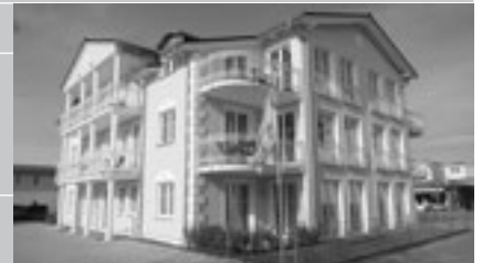
Mietpreis inkl. Servicepakete (bezogene Betten und Handtücher)

Typ C 3-Zimmer-Appartement, bis zu 6 Personen, ca. 104 m 2 , im Dachgeschoss, 1 Schlafzimmer mit Doppelbett, 1 Schlafzimmer mit getrennten Betten, Schlafcouch im Wohnraum, Diele mit Schrank, Waschmaschine, 65 m 2 große umlaufende Dachterrasse, SAT-TV