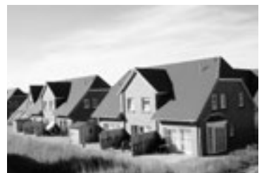
Seepark Burhave aktuelle Wiederverkäufe