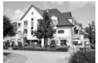
Residenzen Boltenhagen aktuelle Wiederverkäufe