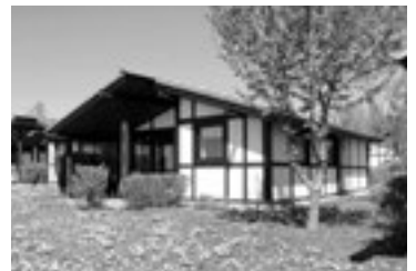
Feriedorf Öfingen aktuelle Wiederverkäufe

Beratung/Informationen erhalten Sie bei Henrichs & Partner GmbH 53125 Bonn | Borsigallee 8-10 Tel. : 0228-91 90 00 | Fax: 0228-919 00 66 www.hp-ferienimmobilien.de | w.henrichs@hptouristik.de