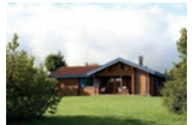
Lauterdörfle aktuelle Wiederverkäufe

Das einzusetzende Eigenkapital , sowie ggf. die Aufnahme eines Darlehens sind ebenfalls Grundlagen eines soliden Verkaufsgesprächs – schließlich wirken diese Faktoren noch lange nach dem Kauf weiter.