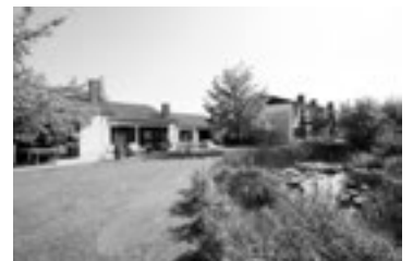
Ferienpark Falkenstein aktuelle Wiederverkäufe