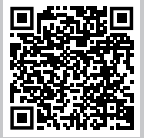
Residenz Haus Elisabeth